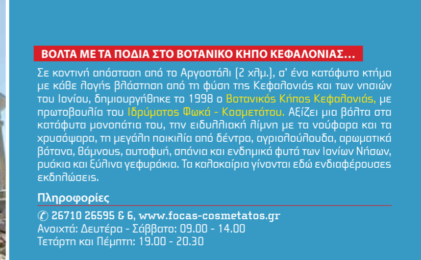
Οι εργασίες δεν σταματούν στο Βοτανικό Κήπο Κεφαλονιάς.