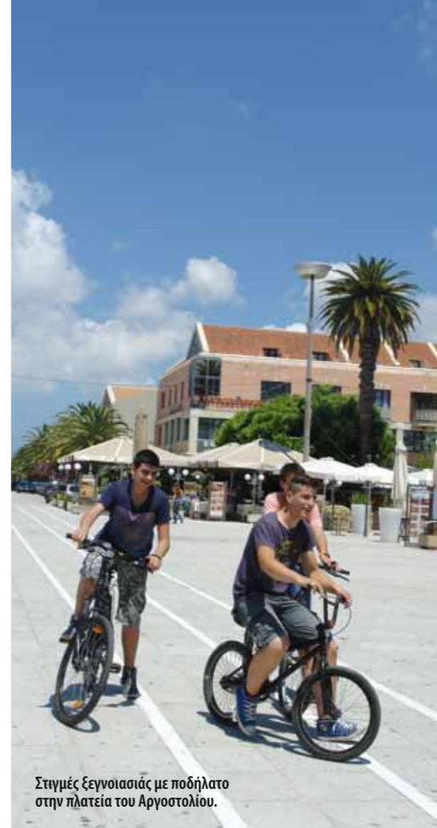
Στιγμές ξεγνοιασιάς με ποδήλατο στην πλατεία του Αργοστολίου.

☎ 6977 533203, www.kephalonia.com , E-mail: cornelia@kephalonia.com