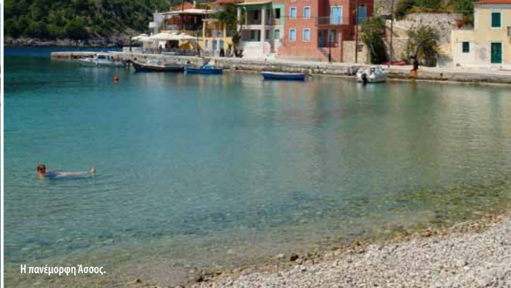
Η πανέμορφη Άσσος.