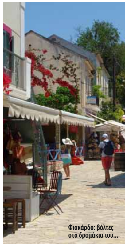
Φισκάρδο: βόλτες στα δρομάκια του...