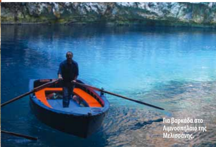
Για βαρκάδα στο Λιμνοσπήλαιο της Μελισσάνης.