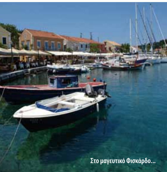
Στο μαγευτικό Φισκάρδο...

Μύρτος, Αντίσαςμος, Πλατύς Γιαθός, Άβυθος, Φώκι (2,5 χλμ. από Φισκάρδο), Άσσος, παραλία Τραπεζιάκι. Στη μεριά του Ληξουρίου: Πόρτο Αθέρας, Ξι, Πετανοί, Βάτσα. Επίσης, Κατελειός και Καμίνια, Πλατιά Άμμος, Έμπηυση, Δαφνούδι, Μηνιές, Άμμες, Αγία Ιερουσαλήμ και Λουρδάς.