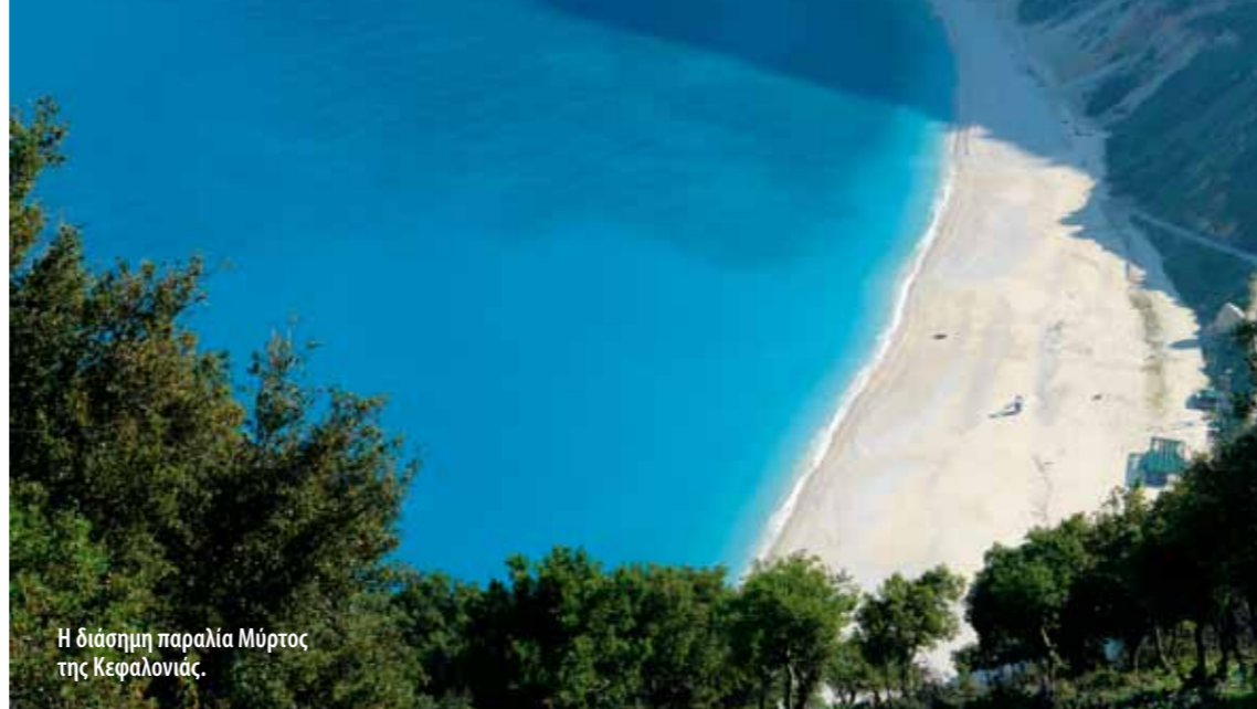
Η διάσημη παραλία Μύρτος της Κεφαλονιάς.