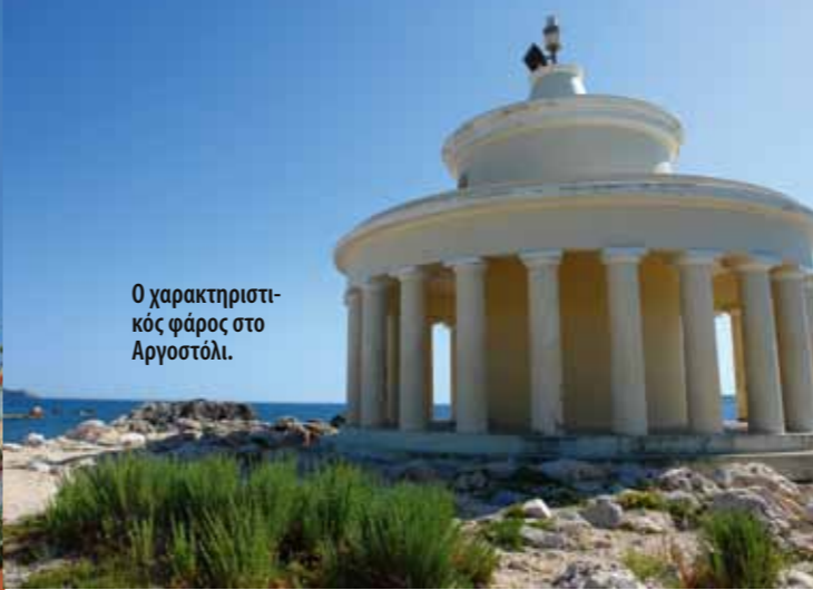
Ο χαρακτηριστικός φάρος στο Αργοστόλι.